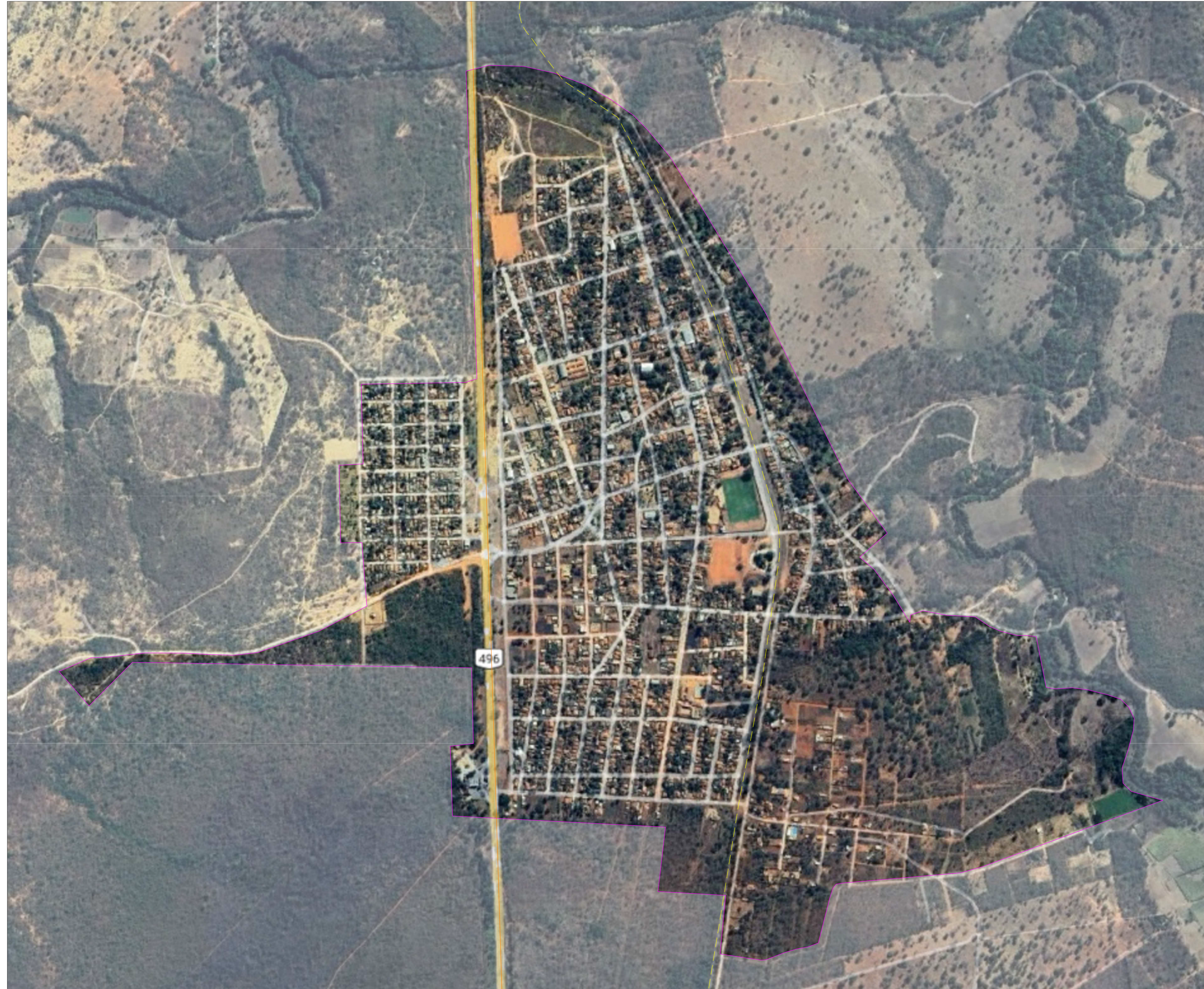
01 MAPA DO PERÍMETRO URBANO PROPOSTO DE LASSANCE ESCALA 1:5000

DATUM HORIZONTAL SIRGAS 2000 Projeção Universal Transversa de Mercator